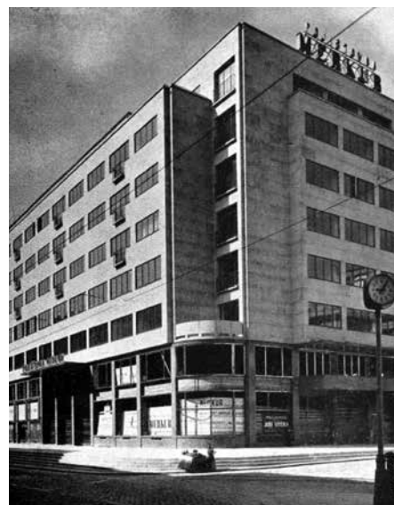
Budova pojišťovny Merkur na rohu Revoluční třídy, v přízemí legendární taneční kavárna Vltava

Ve dvě patnáct vypuká před vchodem lov plechů na cestu kamkoliv na mejdan, v nejhorším případě domů. Neméně důležité konference se zatím odehrály u Munga v Hudební besedě, u zmíněných Zpěváčků nebo pro zvlášť tvrdé chlapece k ránu Na Váze mezi uhlíři na Smíchově. U Kalendů je ještě roleta, tam otevírají až v půl páté ráno. Nikde se nehraje, rocker nemá potřebu hrát, když se má pít. To jen jazzmani ventilují virtuozitu ve Viole, Redutě, Vagónu či v Parnasu, kde jim fanoušci lezou do zadku výkřiky „Ano! Velké ano!“. Dopíjí se a domlouvají se party vyrážející na